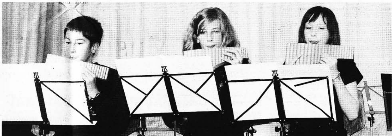
Zur Abwechslung gab es zwischendurch auch mal leise Töne: Die Panflöte ist ein spannendes Instrument, das nicht an sehr vielen Schulen unterrichtet wird.