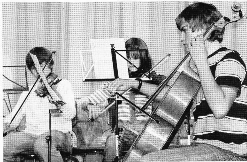
Tanzbare irische Volksmusik brachte das Violinensemble, verstärkt mit einem Cello, auf die Bühne.