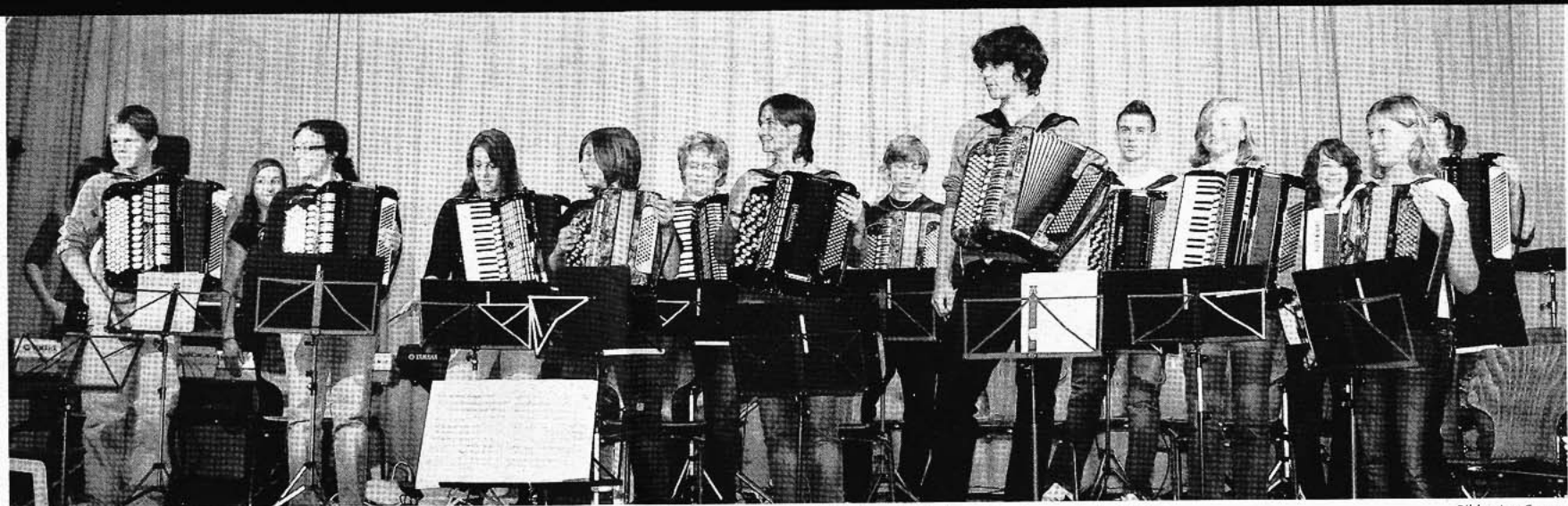
Bilder: Leo Ferraro